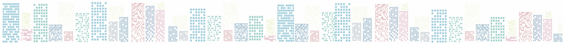
Tabela de Custas